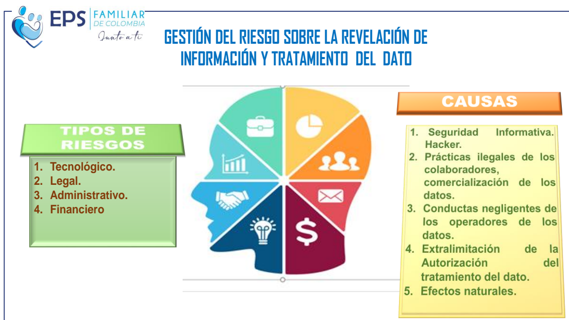
Ilustración 1. Lineamientos para la gestión de riesgo.