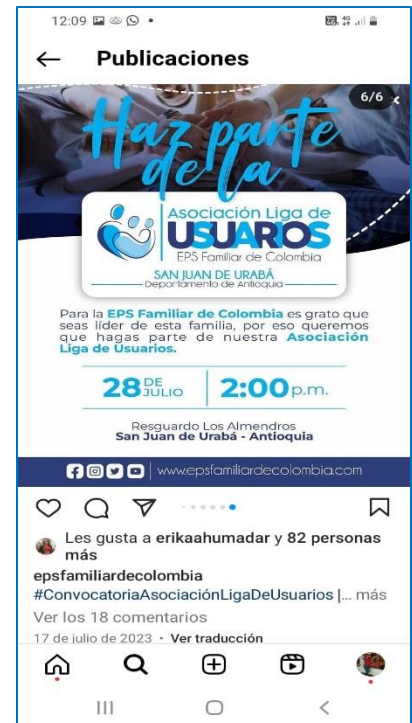
San Juan de Urabá