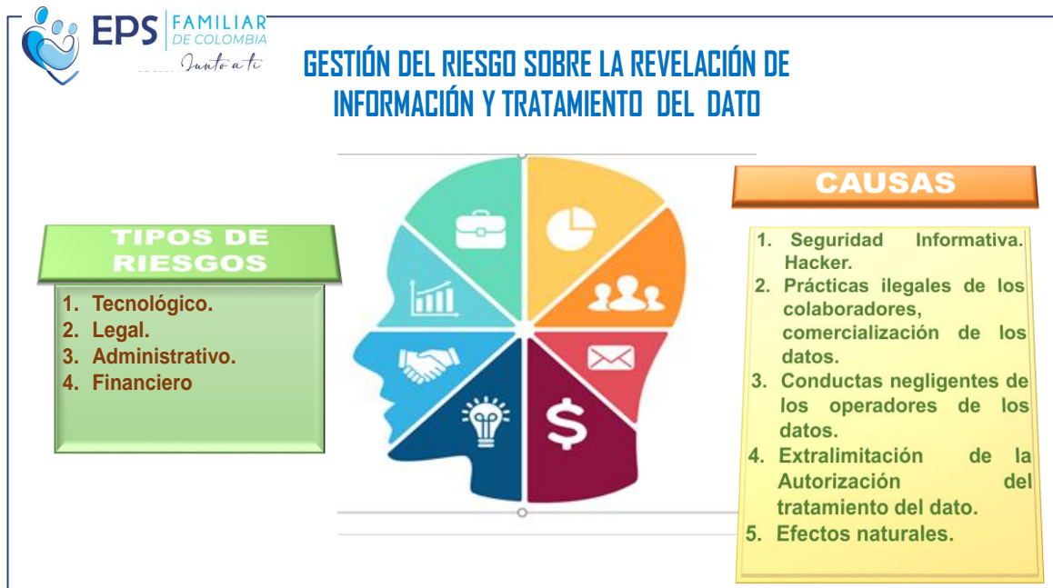
Ilustración 1. Lineamientos para la gestión de riesgo.