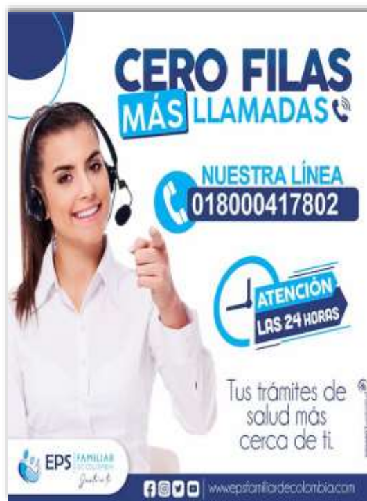
Línea nacional 01 8000