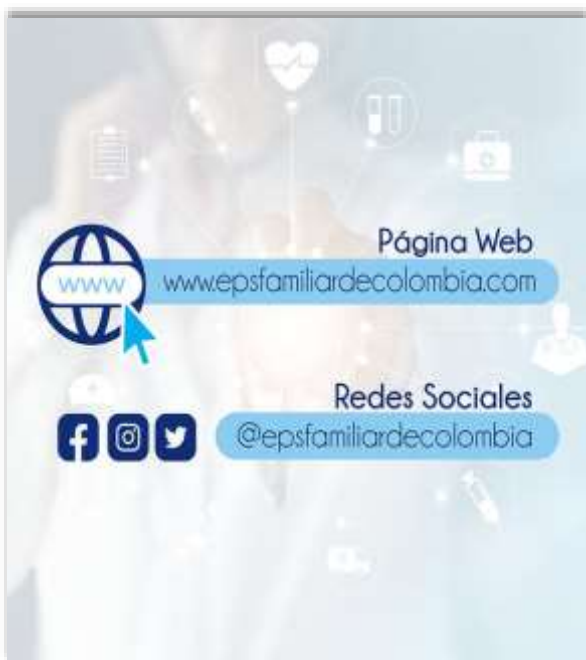
Página web - redes sociales

VIRTUAL : En este canal de comunicación fomentamos la Participación Ciudadana a través de los siguientes mecanismos: